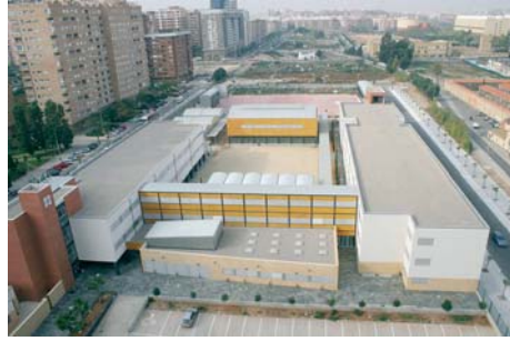
■ Planta General ■ Planta General