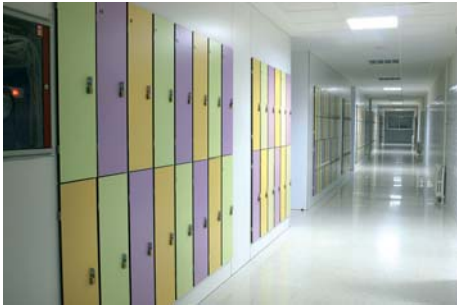
■ Secció B ■ Sección B