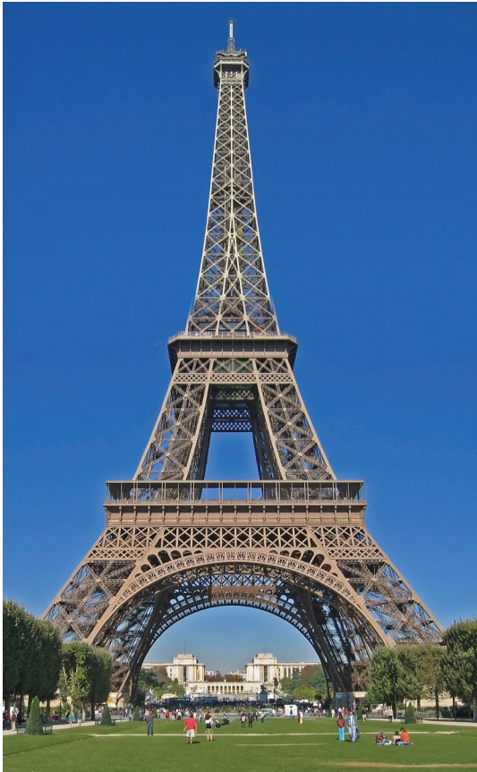
IMATGE 1 / IMAGEN 1

Imatge 1: Torre Eiffel. París. Gustavo Eiffel. 1889.