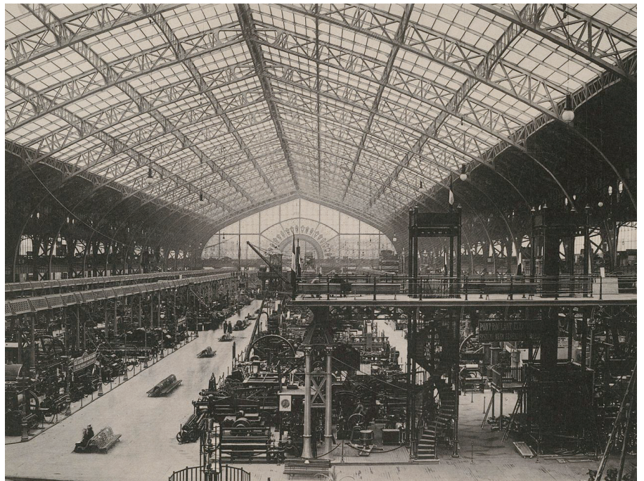
IMATGE 2 / IMAGEN 2

Imagen 1: Torre Eiffel. País. Gustavo Eiffel. 1889.