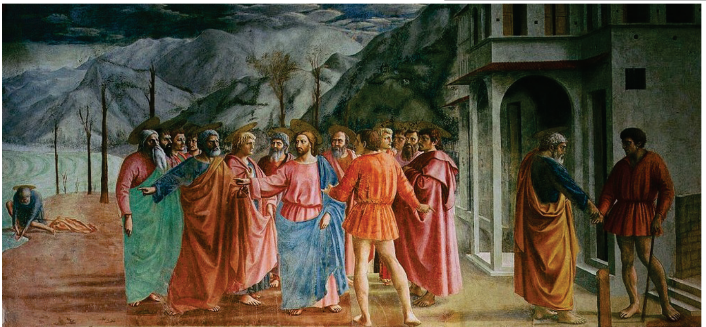
Imagen 2: Tributo de la moneda . Massacio.1427.

Imatge 2: Tribut de la moneda . Massacio. 1427