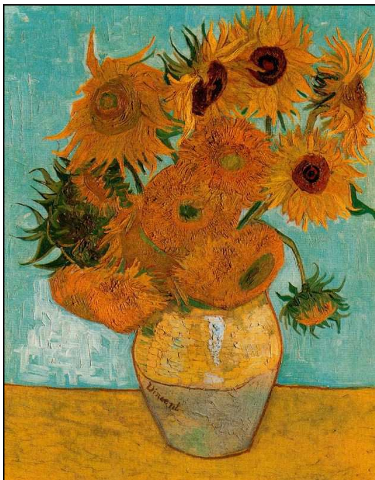
Vincent Van Gogh (1853-1890)

Interpreta esta obra o un fragmento de ella utilizando la técnica de la acuarela y combina una gama cromática fría. El soporte debe tener un tamaño DIN A4 y adecuarse a la técnica.