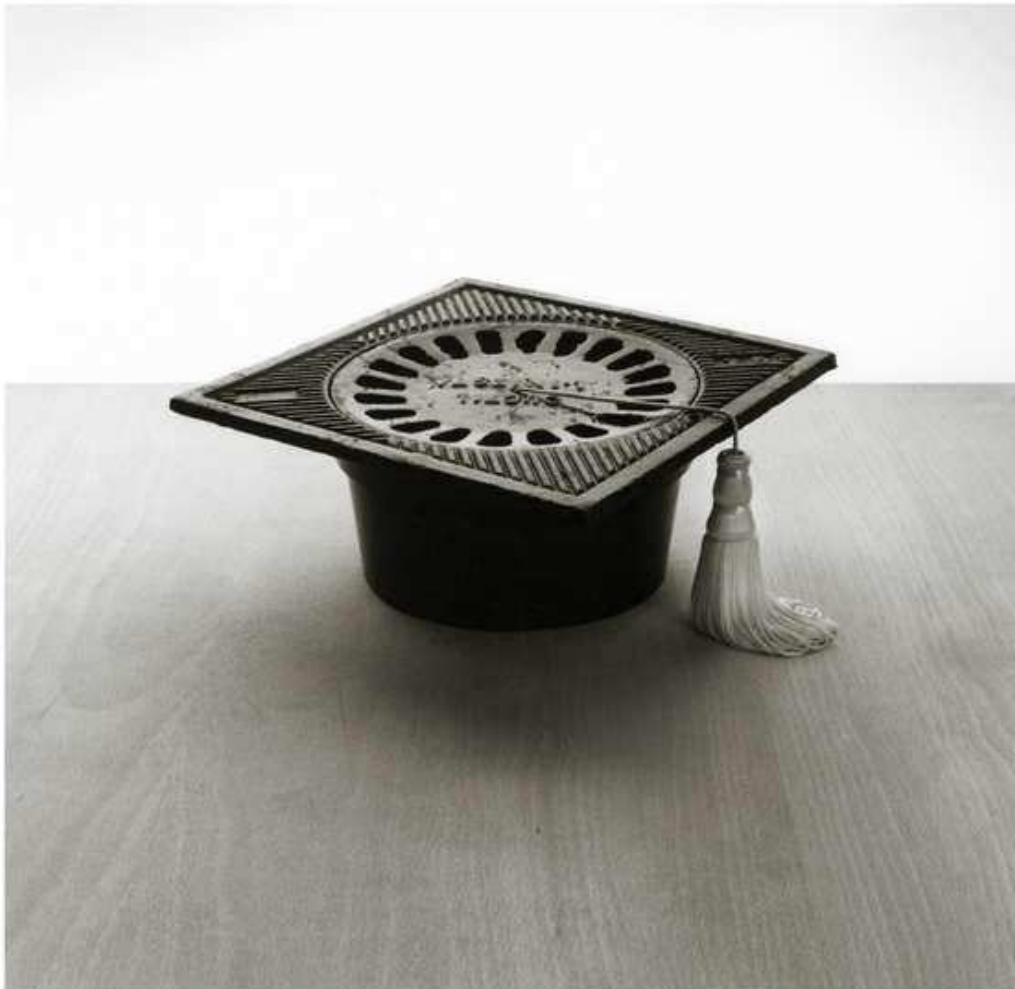
Fotògraf: Chema Madoz. Sense títol. Sense data.