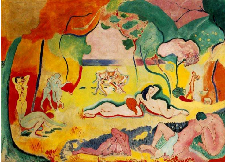
IMATGE 1 / IMAGEN 1

Imatge 1. Matisse. L'alegría de viure. 1905-1906.