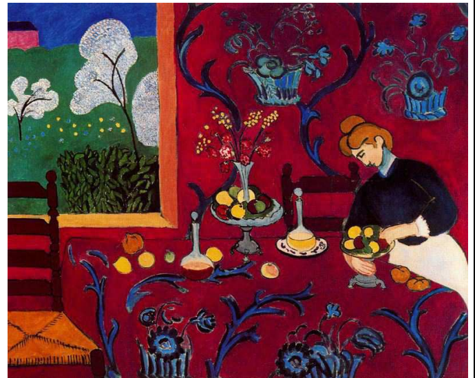
IMATGE 3 / IMAGEN 3

Imagen 2. Matisse. Armonía en rojo. 1908.