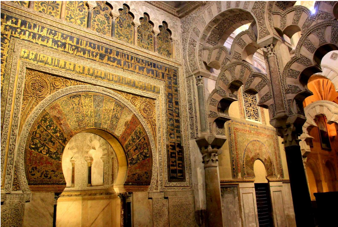
IMATGE 1 / IMAGEN 1