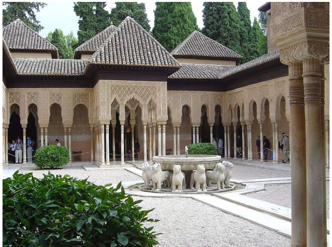
IMATGE 2 / IMAGEN 2