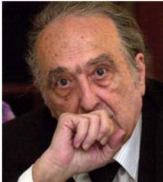
RAFAEL SÁNCHEZ FERLOSIO

Dirección General del Libro y Bibliotecas