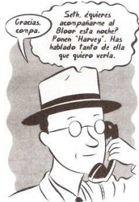
Seth. La vida está bien, si no te rindes

Escriba alguna definición adecuada de cómic y, tomando como referencia estas viñetas sueltas de diversas historietas de autores diferentes, nombre y defina los elementos estructurales y recursos propios del lenguaje del cómic. (10 puntos)