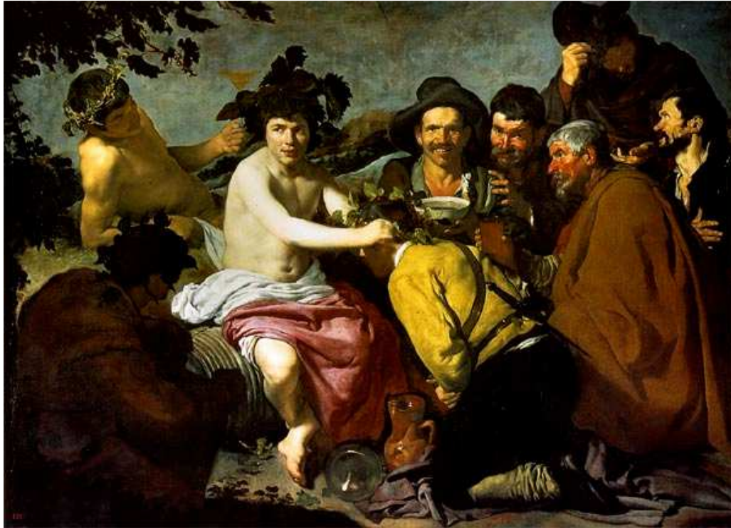
El triomf de Bacus. Diego Velázquez. 1629. Madrid

Comente una de les dos imatges següents. Per a això, pot utilitzar l'esquema següent: descripció de l'obra, relació amb l'estil artístic a què pertany i influències rebudes i exercides. (10 punts)