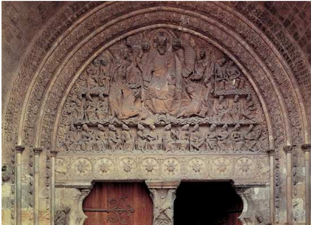
Portada de l'església de Sant Pere de Moissac. França. Segle XII