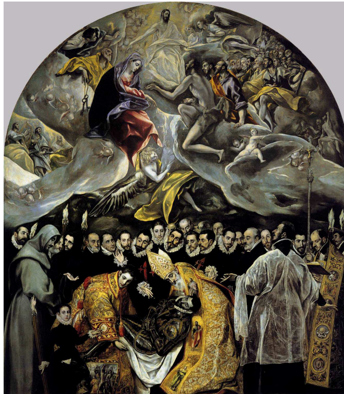
El entierro del conde Orgaz. El Greco. 1566-88. Toledo