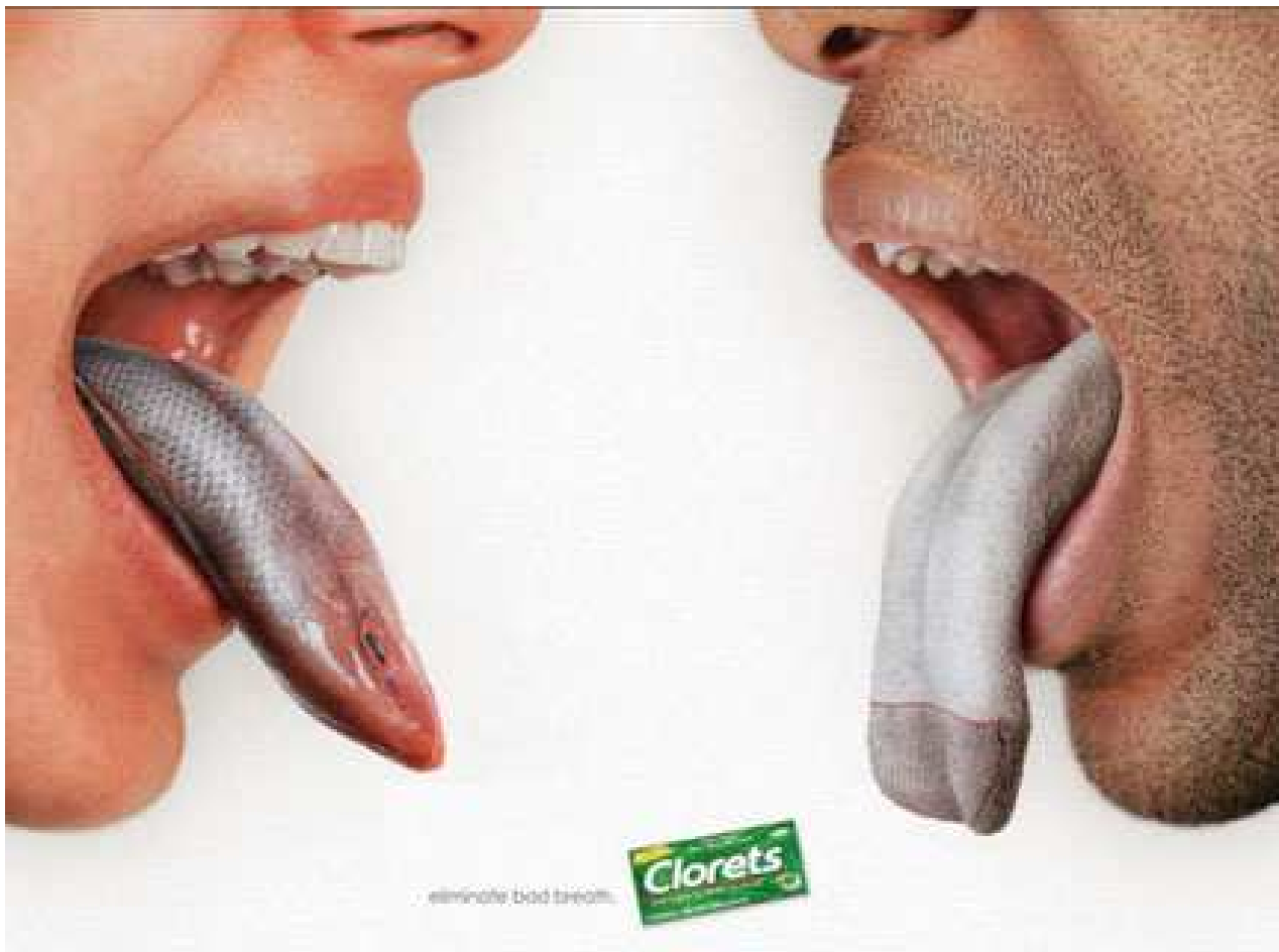
Anuncio publicitario de chicles Clorets. Eliminate bad breath ( Elimina el mal aliento)

Realice un análisis completo de esta imagen. En primer lugar a un nivel descriptivo, y en segundo lugar a un nivel icónico. (10 Puntos)