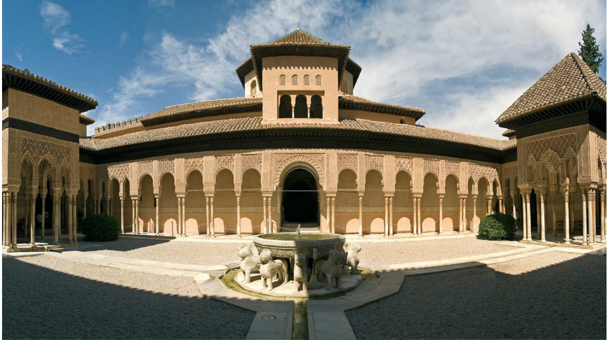
Patio de los Leones de la Alhambra de Granada. S.XIV

Comente una de las dos imágenes siguientes. Para ello puede utilizar el siguiente esquema: descripción de la obra, relación con el estilo artístico al que pertenece e influencias recibidas y ejercidas. (10 puntos)