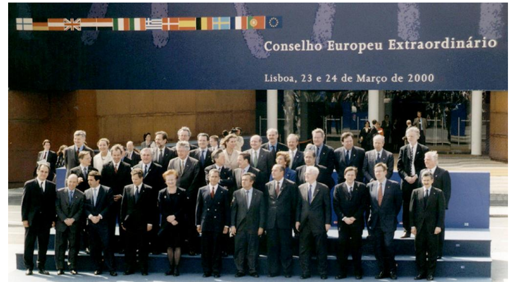
Consejo Europeo del 23 y 24 de marzo de 2000 en Lisboa

Reducir a la mitad en 2010 el número de jóvenes de 18 a 24 años con educación secundaria que no siguen estudios o formación profesional (= abandono educativo prematuro).