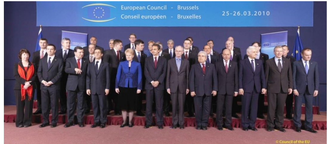
Consejo Europeo del 25 y 26 de marzo de 2010 en Bruselas