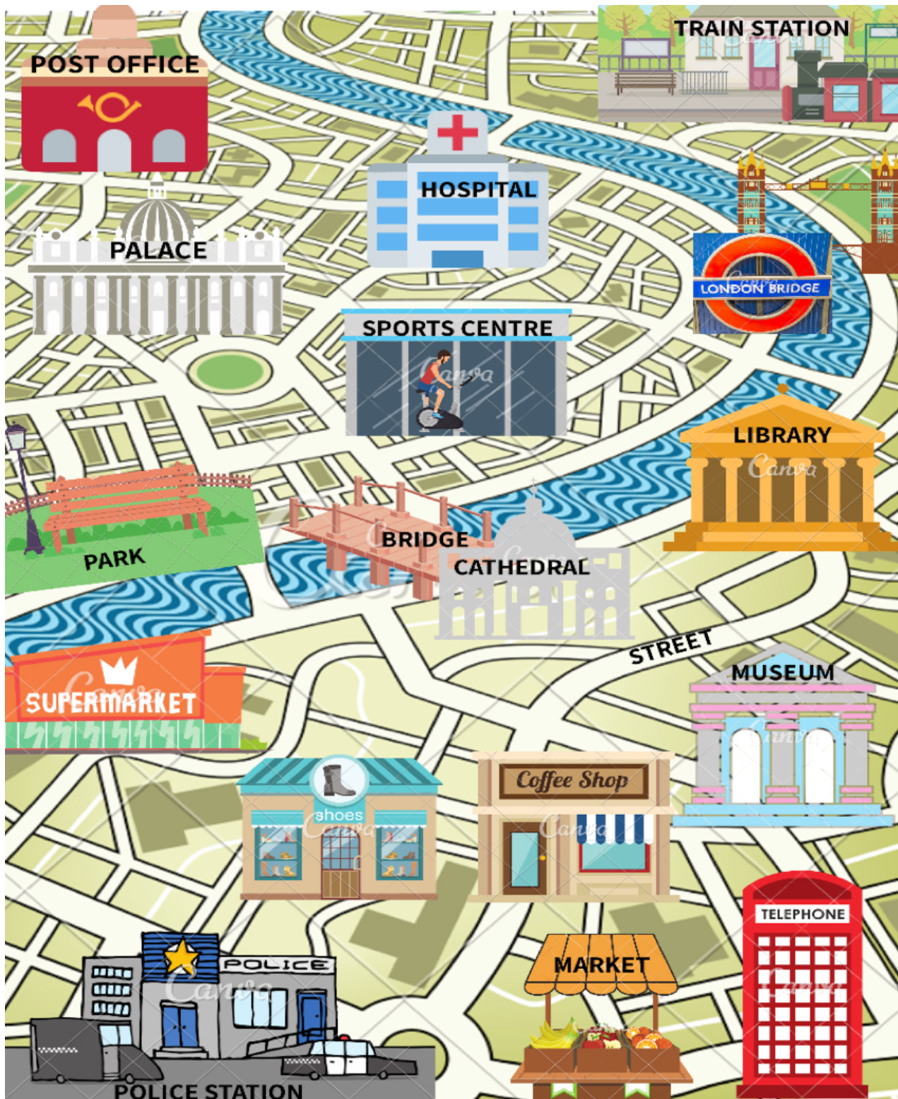
Imágen creada por Clara Quiles en Canva cc by-nc-sa