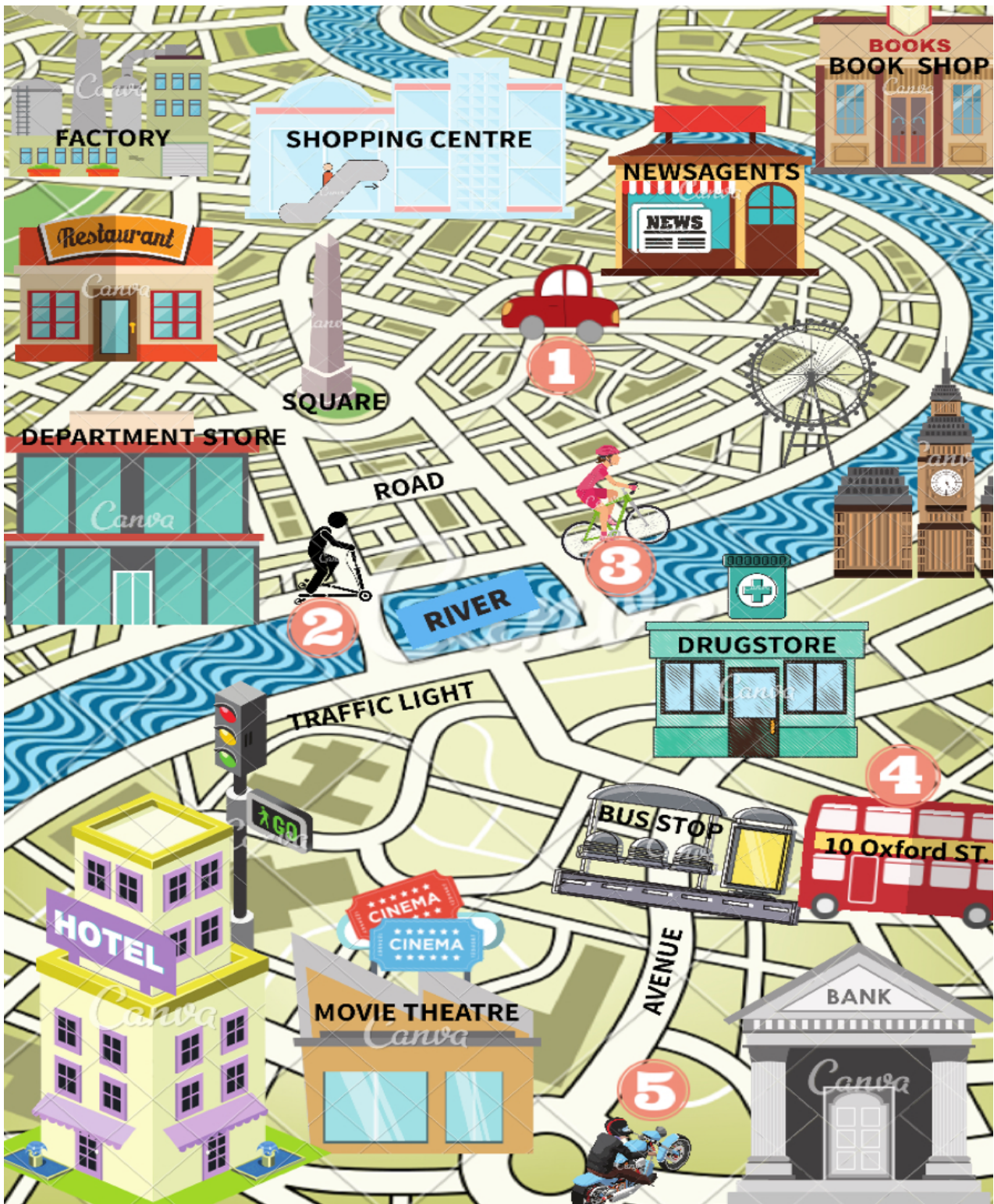
Imágen creada por Clara Quiles en Canva cc by-nc-sa

4. Localiza los medios de transporte de la imagen anterior, ¿sabes cómo se dicen en inglés? Intenta relacionar cada palabra con los transportes: