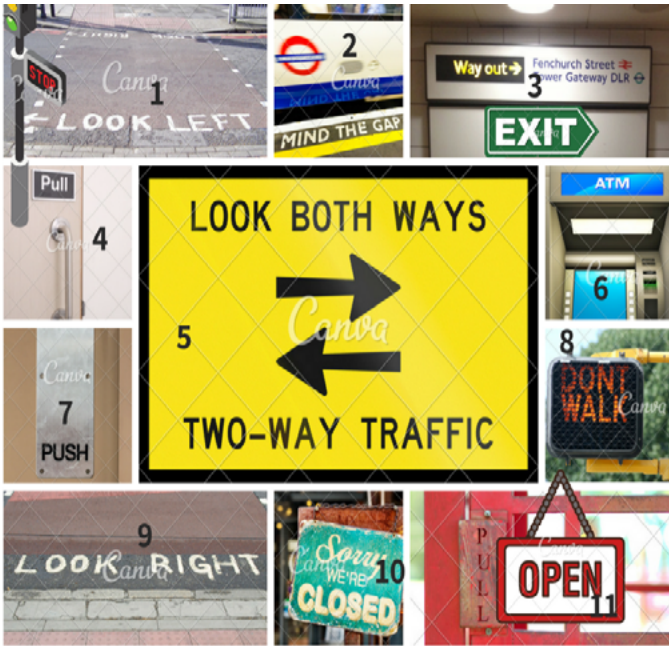
Imágen creada por Clara Quiles en Canva cc by-nc-sa

Además de lugares, tiendas, establecimientos, transportes... En la ciudad veremos señales y letreros que debemos entender para no cometer ninguna infracción, como por ejemplo algunas de éstas. Observa, seguro que alguna de ellas te suena...¿ A que sí?