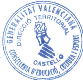
M. JOSEP PALMER COMPANYY