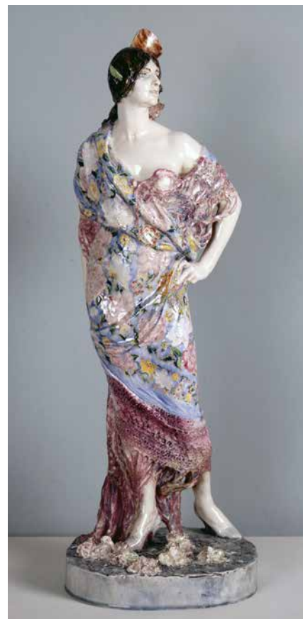
Mariano Benlliure Gil: Chula (1927) Ceràmica. Donació Goerlich-Miquel (1963). Inv. 1190