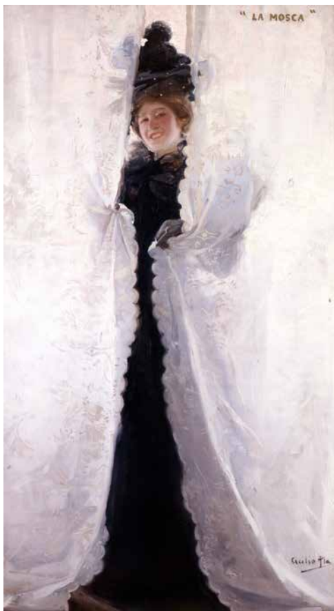
Cecilio Pla Gallardo: La mosca (1897)

Oli sobre tela. Col·lecció Reial Acadèmia de Belles Arts de Sant Carles. Inv. 1250