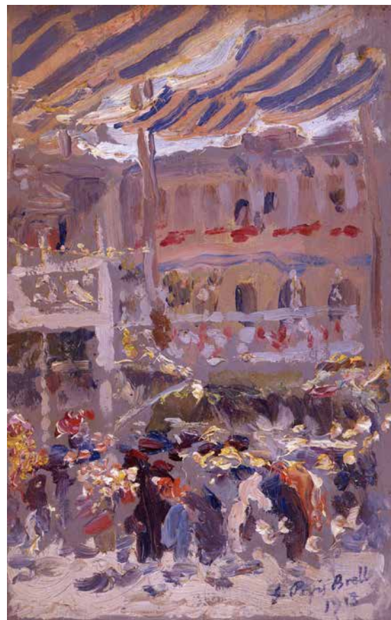
Julio Peris Brell: Plaça de la Mare de Déu (1913) Oli sobre fusta. Adquirit per la Generalitat (2001). Inv. 25/2001

El trànsit dels segles XIX al XX va estar marcat en les terres valencianes per transformacions econòmiques i socials profundes, determinades, en gran manera, per la crisi del tipus d'agricultura