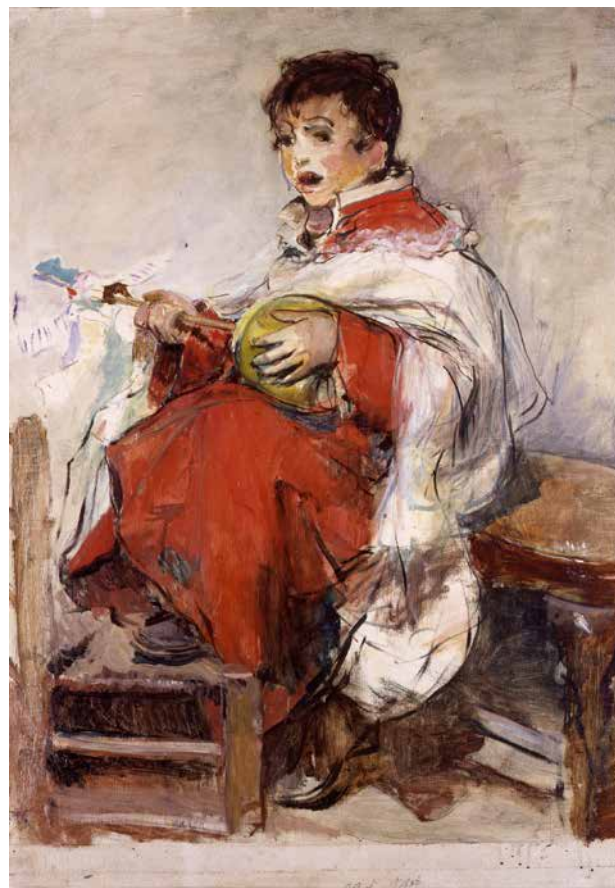
Ignacio Pinazo Camarlench: Escolà tocant la simbomba (ca. 1894) Oli sobre tela. Col·lecció Reial Acadèmia de Belles Arts de Sant Carles. Inv. 723

Sorolla li va deure a Antonio Muñoz Degraín, a més, el gust que tenia per la pintura visual, de lluminositat intensa i gran colorit.