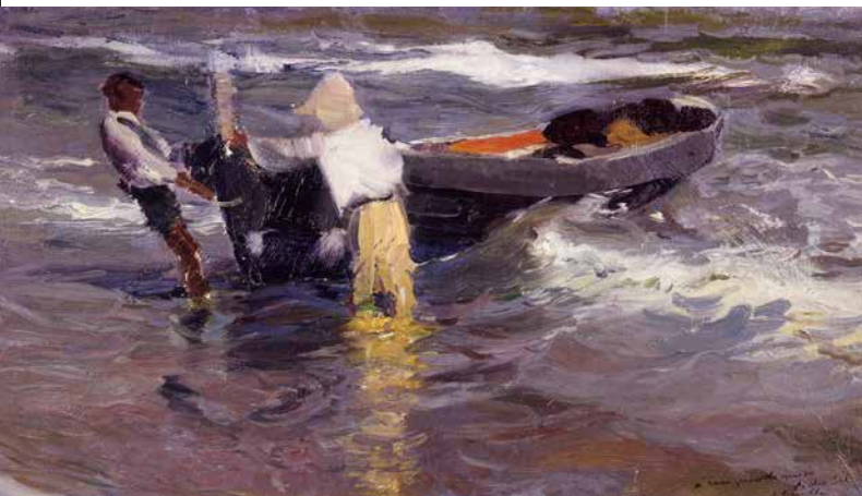
Joaquín Sorolla i Bastida: Marina (ca. 1907) Oli sobre tela. Donació de CEMEX (2007). Inv. 1/2007