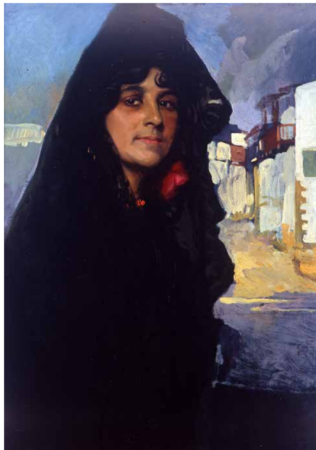
Manuel Benedito Vives: Castissa

Encara que Joaquín Sorolla es va postular com el principal artista valencià del seu temps, van ser molt pocs els deixebles directes