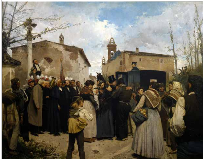
Antonio Fillol Granell: La gloria del poble (1895) Oli sobre tela. Depòsit del Museu Nacional del Prado. Inv. 1246

Durant els cinc anys que Joaquín Sorolla va continuar la formació acadèmica en l'Escola de Belles Arts de Sant Carles de València,