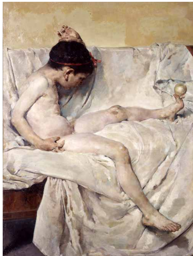
Ignacio Pinazo Camarlench: Jocs d'ícar (1877). Oli sobre tela. Depòsit de la Diputació de València. Inv. 724

Aquests artistes van representar el corrent artístic més tradicional, dominat pel gènere de la pintura d'història, amb les obres de la qual podien participar anualment en les exposicions nacionals